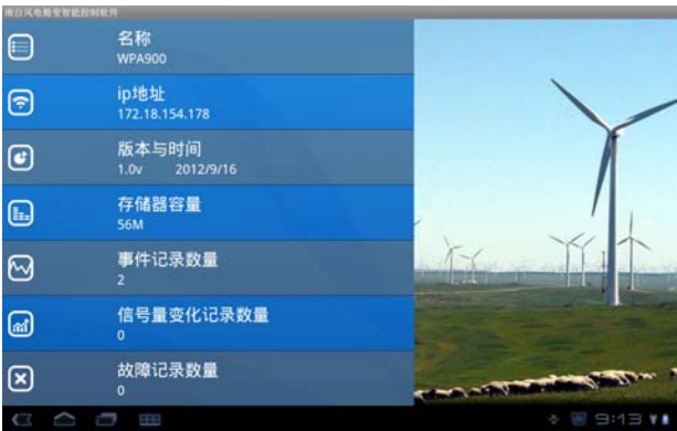
图 3 智能平板电脑程序画面

智能手机和平板电脑:两者在数据网络上接收报警的方式是一样的。在终端上开启一个应用程序并保持后台运行,时刻准备接收报警信息。由于手机可以插入 sim,这样使得手机可以接收短信,使得查看报警信息更加直观方便。见图 3。