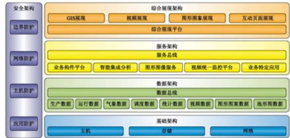
图 2 系统总体架构图

海南电网全景展现运行指挥系统的总体架构由基础架构、数据架构、服务架构、综合展现架构、安全架构组成。各组成部分既独立支撑系统的部分功能,相互又协调配合,进行功能上的支持和辅助。见图 2。