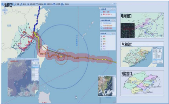
图 1 气象信息展现图

气象信息综合展现主要实现对来自公司气象服务系统的气象信息数据、应用分析结果数据、气象预警分析数据等的展示,为电网各专业在安全生产及故障处置等工作提供辅助支持,以充分利用气象信息资源合理安排电力生产调度,有效的实现电力设施的防灾、减灾。气象信息综合展现结合 GIS 地形图、GIS 专题图、报表、点图、线图、面图、动画、多图联动等多种可视化表现方式,对气象数据从不同层面、不同维度予以表达,以满足不同部门和不同层面的需求,见图 1。