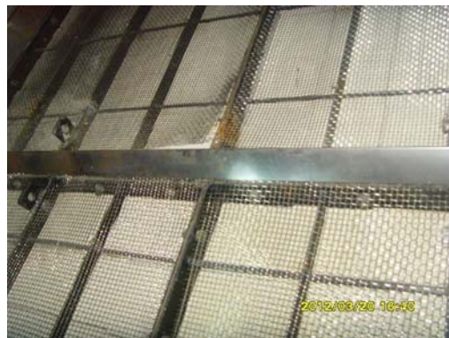
图 2 密封片焊点较少

点过少 (见图 2、图 3), 催化剂箱体横向和纵向密封片搭边处间隙过大等问题, 运行中箱体膨胀变形, 会造成漏烟量增大, 起不到密封作用, 造成脱硝效率下降。