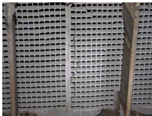
图 4 SK 催化剂进、出断面发生开裂

(6) 在施工过程中, 对上层已运行的韩国 SK 催化剂进行了检查, 发现在多只催化剂上下口端面存在不同程度的裂纹和破损 (见图 4)。分析认为 SK 催化剂在运行中存在耐温和机械强度不足, 经了解其他厂家使用 SK 催化剂产品也普遍存在此现象, 发生最严重的是脱硝运行一年后整个催化剂都破碎塌陷, 不能再使用。