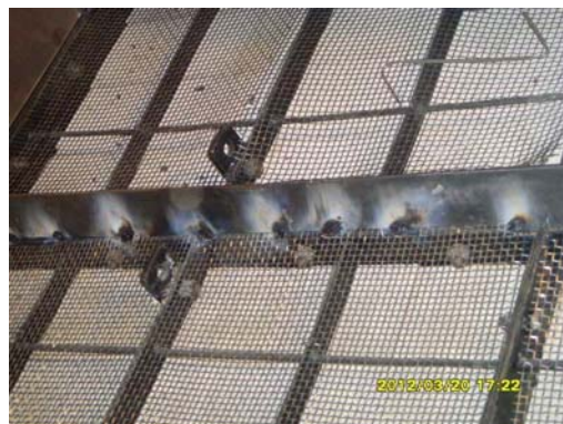
图 3 密封片增加焊点后

(6) 在施工过程中, 对上层已运行的韩国 SK 催化剂进行了检查, 发现在多只催化剂上下口端面存在不同程度的裂纹和破损 (见图 4)。分析认为 SK 催化剂在运行中存在耐温和机械强度不足, 经了解其他厂家使用 SK 催化剂产品也普遍存在此现象, 发生最严重的是脱硝运行一年后整个催化剂都破碎塌陷, 不能再使用。