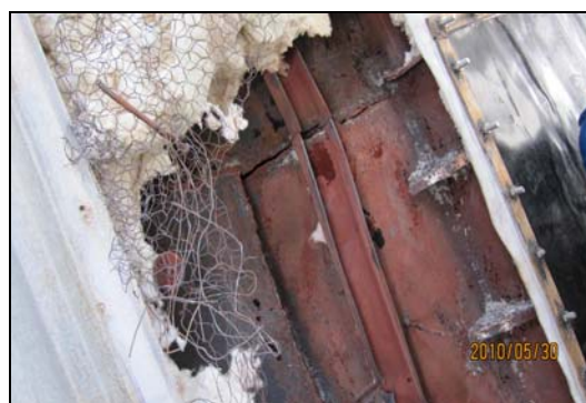
图8 密封框架外再次开裂