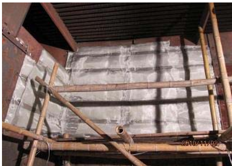
图15 保温和不锈钢丝网施工