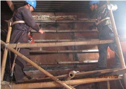
图 14 焊接压条螺栓和压板

140mm，硅酸铝纤维毯内外层错缝、压缝安装(图17)。钢丝网包扎应平整，搭接尺寸应大于100mm。外装饰板用专用螺钉固定。