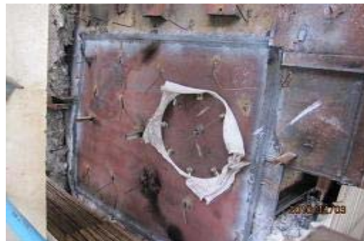
图 13 应力释放孔

(5) 现场开设墙板应力释放孔: #1 角和 #4 角开孔 \Phi 400\text{mm} , #2 角开孔 \Phi 200\text{mm} ,并用盲板法兰密封(图 13)。