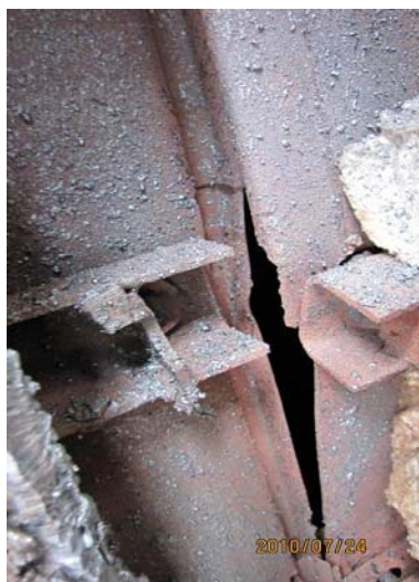
图5 内衬板变形和开裂