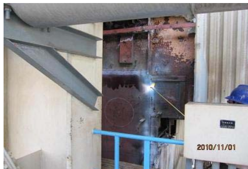
图 12 热处理

(4) 焊后热处理是墙板改造工作的重点,同时也是最大的难点。根据现场实际,采用火焰加热、外保温缓冷的热处理方式(图 12),同时用红外测温仪监测表面温度,由专人负责升温、最高温度、保温时间和缓冷措施的落实:每条焊缝分别热处理;焊缝内外侧同时加热;恒温最高温度在 600^{\circ}\text{C}\sim 650^{\circ}\text{C} 波动,时间平均在 40min (厚度 \delta 8\text{mm} 和 \delta 12\text{mm} ),采用硅酸铝毯保温缓冷。