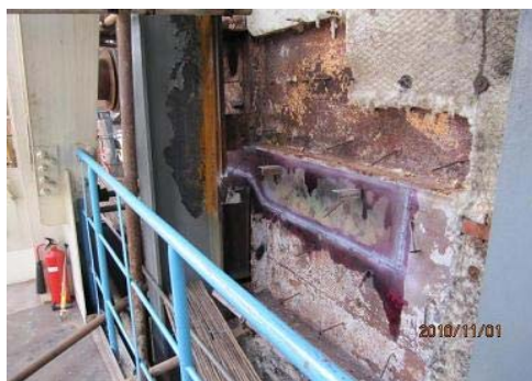
图 11 焊前焊后 PT 探伤

(4) 焊后热处理是墙板改造工作的重点,同时也是最大的难点。根据现场实际,采用火焰加热、外保温缓冷的热处理方式(图 12),同时用红外测温仪监测表面温度,由专人负责升温、最高温度、保温时间和缓冷措施的落实:每条焊缝分别热处理;焊缝内外侧同时加热;恒温最高温度在 600^{\circ}\text{C}\sim 650^{\circ}\text{C} 波动,时间平均在 40min (厚度 \delta 8\text{mm} 和 \delta 12\text{mm} ),采用硅酸铝毯保温缓冷。