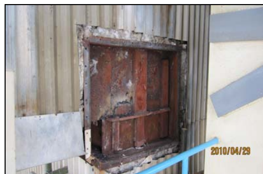
图6 锅炉转角烟道密封框架图