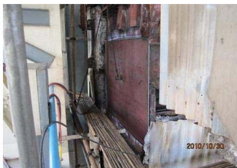
图 10 焊前 PT 探伤

(3) 沿墙板画线区域切割墙板,严格要求坡口制备工艺,以满足不同厚度双面焊接的质量要求;打磨坡口及周围 30mm 露出金属光泽,坡口 PT 探伤,新、旧母材进行现场光谱分析;配制 \delta 12\text{mm} 15CrMo 墙板和筋板(#1 角 1697\text{mm}\times 1463\text{mm} 一块;#2 角 2800\text{mm}\times 400\text{mm} 一块 30\text{mm}\times 235\text{mm} 一块;#4 角 1280\text{mm}\times 1380\text{mm} 一块),施焊预热和焊后热处理。R307 焊条按技术要求进行烘焙;墙板焊接完成后对焊缝进行外观检查 100%PT 探伤(图 10、图 11)。