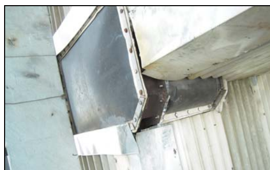
图7 锅炉转角烟道蒙皮密封图