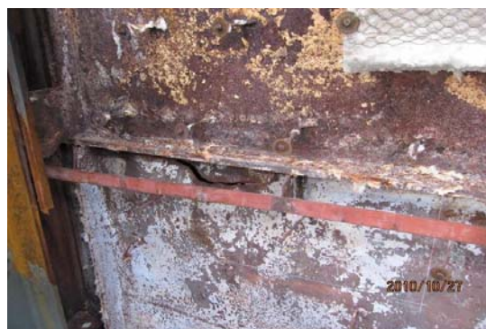
图9 密封框架外再次开裂